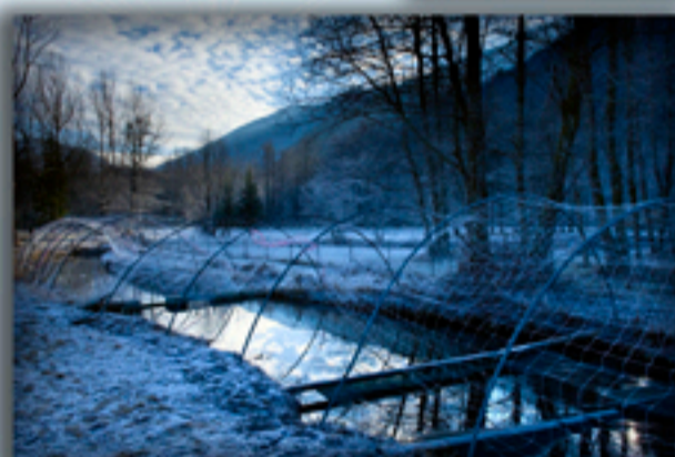
Illustrazione di Piergiuseppe Perucca sui lavori svolti dall'Associazione nell'ambito del progetto insistente presso l'incubatoio di Fossano e la zona di stabulazione di Demonte. Trota Marmorata e Fario Mediterranea le protagoniste...